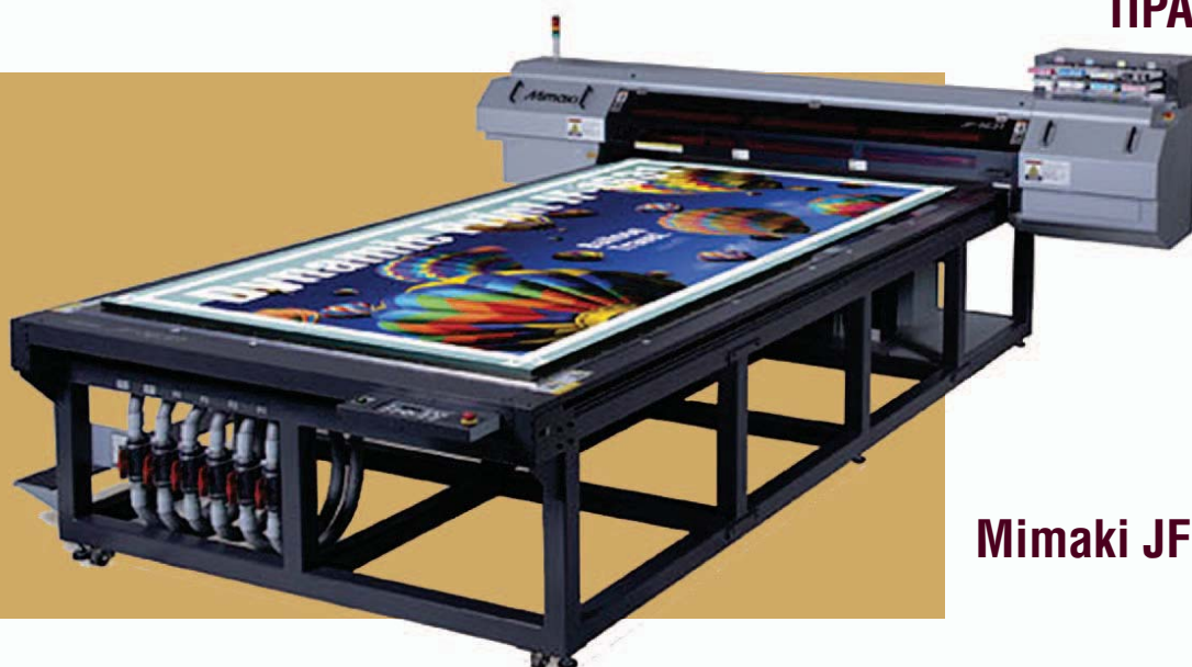
Mimaki JF 1631

На УФ-Mimaki JF 1631 выполняются работы для наружной и интерьерной рекламы, размер печати 1600 на 3100 мм, толщина запечатываемого материала до 50 мм. Благодаря УФ-отверждаемым чернилам возможна печать по широкому спектру материалов: Самоклеющаяся бумага, винил, бумага, пластик, оргстекло, композит, дерево, металл, керамическая плитка, стекло и др.